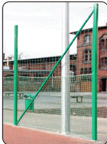
C. ZASTRZAŁ MOCOWANY DO SKRAJNEGO SŁUPA