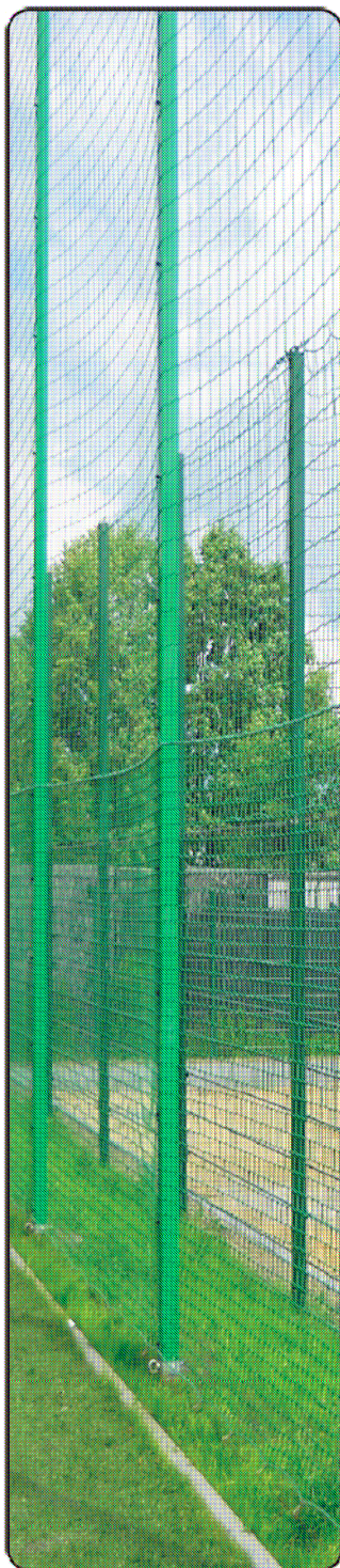
A. SŁUP ALUMINIOWY