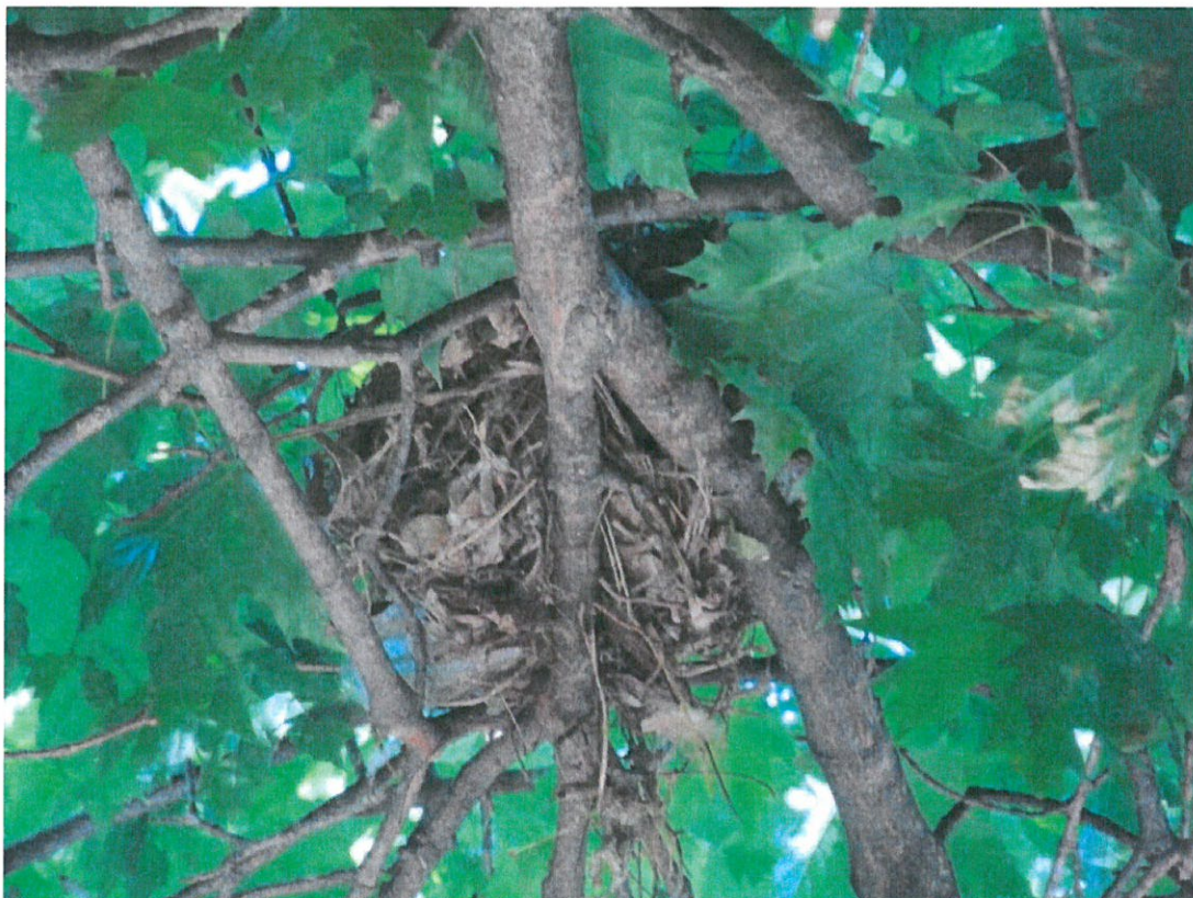
zdj. 1. Niezasiedlone gniazdo ptasie na obiekcie nr 44.

Na podstawie przeprowadzonej wizji terenowej, w lipcu 2019 roku, w obszarze opracowania stwierdzono jedno niezasiedlone gniazdo ptasie na obiekcie o numerze 44 - patrz zdjęcie poniżej.